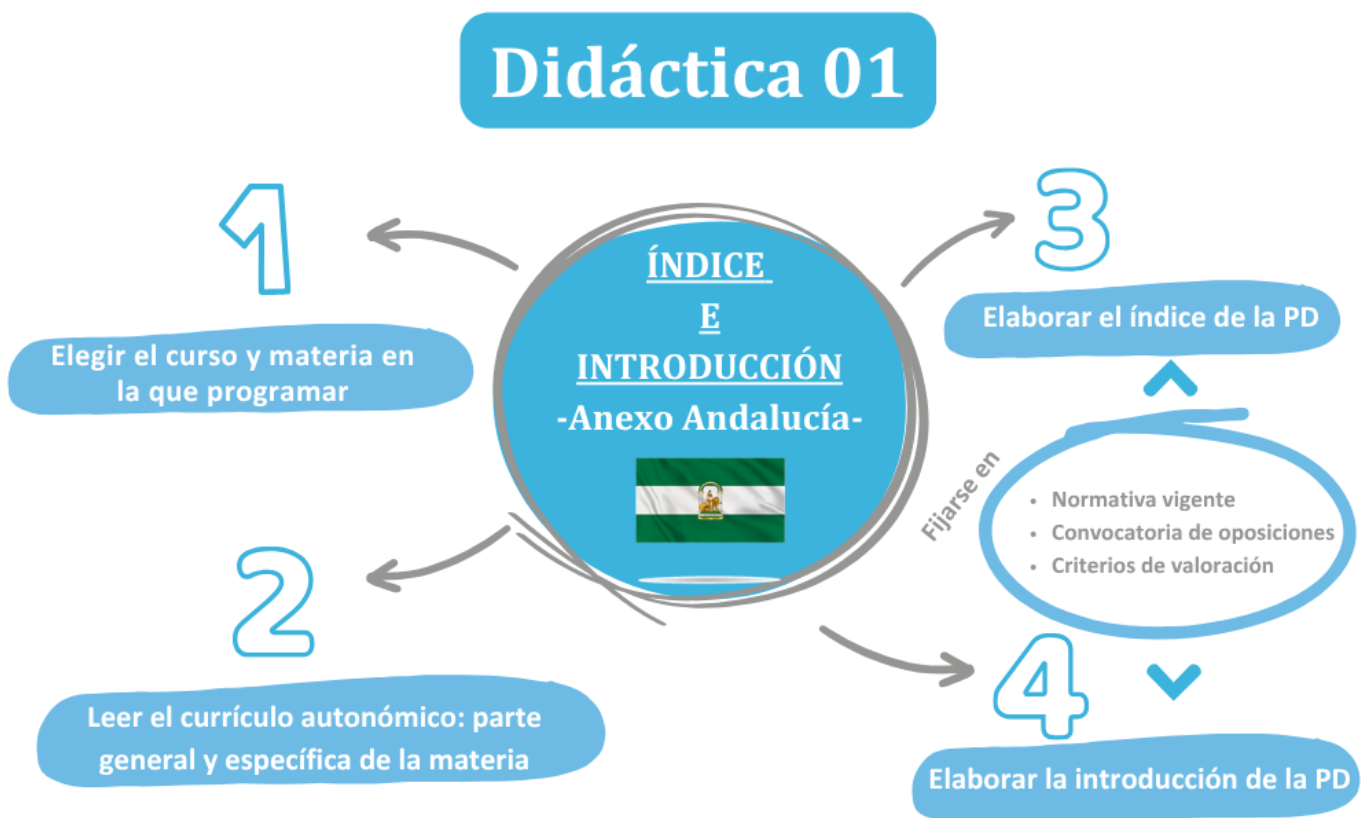
Imagen 2. ¿Qué hay que hacer esta semana?

Una vez que hayas hecho el índice, el siguiente paso es elaborar la introducción de tu programación didáctica, que consiste en presentar las características de la materia, el curso y la etapa en que se enmarca, así como explicar los fundamentos sociales y pedagógicos que justifican su enseñanza. También debes hablar sobre la importancia de programar en educación.