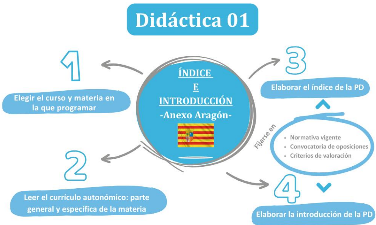
Imagen 2. ¿Qué hay que hacer esta semana?

Una vez que hayas hecho el índice, el siguiente paso es elaborar la introducción de tu programación didáctica, que consiste en presentar las características de la materia, el curso y la etapa en que se enmarca, así como explicar los fundamentos sociales y pedagógicos que justifican su enseñanza.