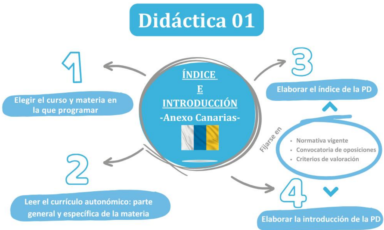
Imagen 2. ¿Qué hay que hacer esta semana?

Una vez que hayas hecho el índice, el siguiente paso es elaborar la introducción de tu programación didáctica, que consiste en presentar las características de la materia, el curso y la etapa en que se enmarca, así como explicar los fundamentos sociales y pedagógicos que justifican su enseñanza.