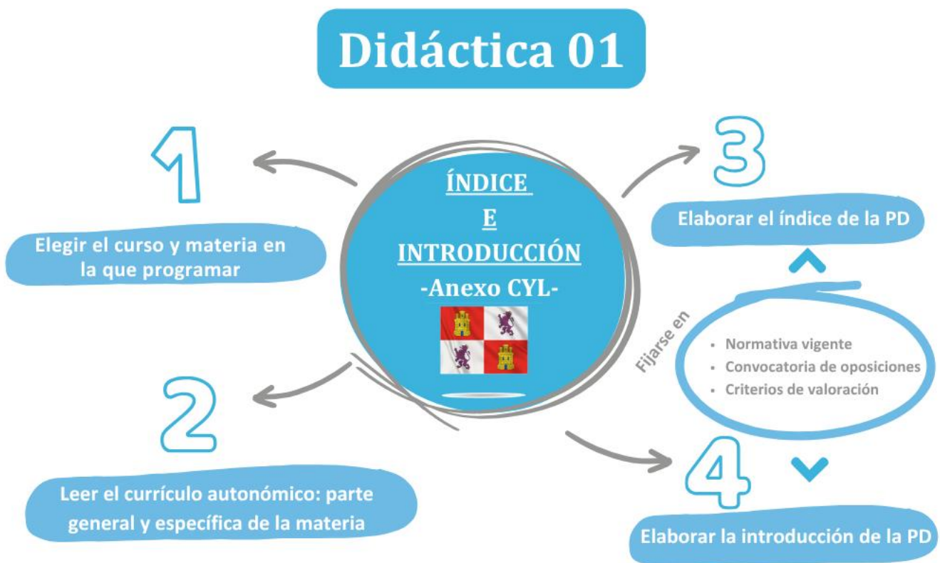
Imagen 2. ¿Qué hay que hacer esta semana?

Una vez que hayas hecho el índice, el siguiente paso es elaborar la introducción de tu programación didáctica, que consiste en presentar las características de la materia, el curso y la etapa en que se enmarca, así como explicar los fundamentos sociales y pedagógicos que justifican su enseñanza con coherencia interna y visión de conjunto de la programación.