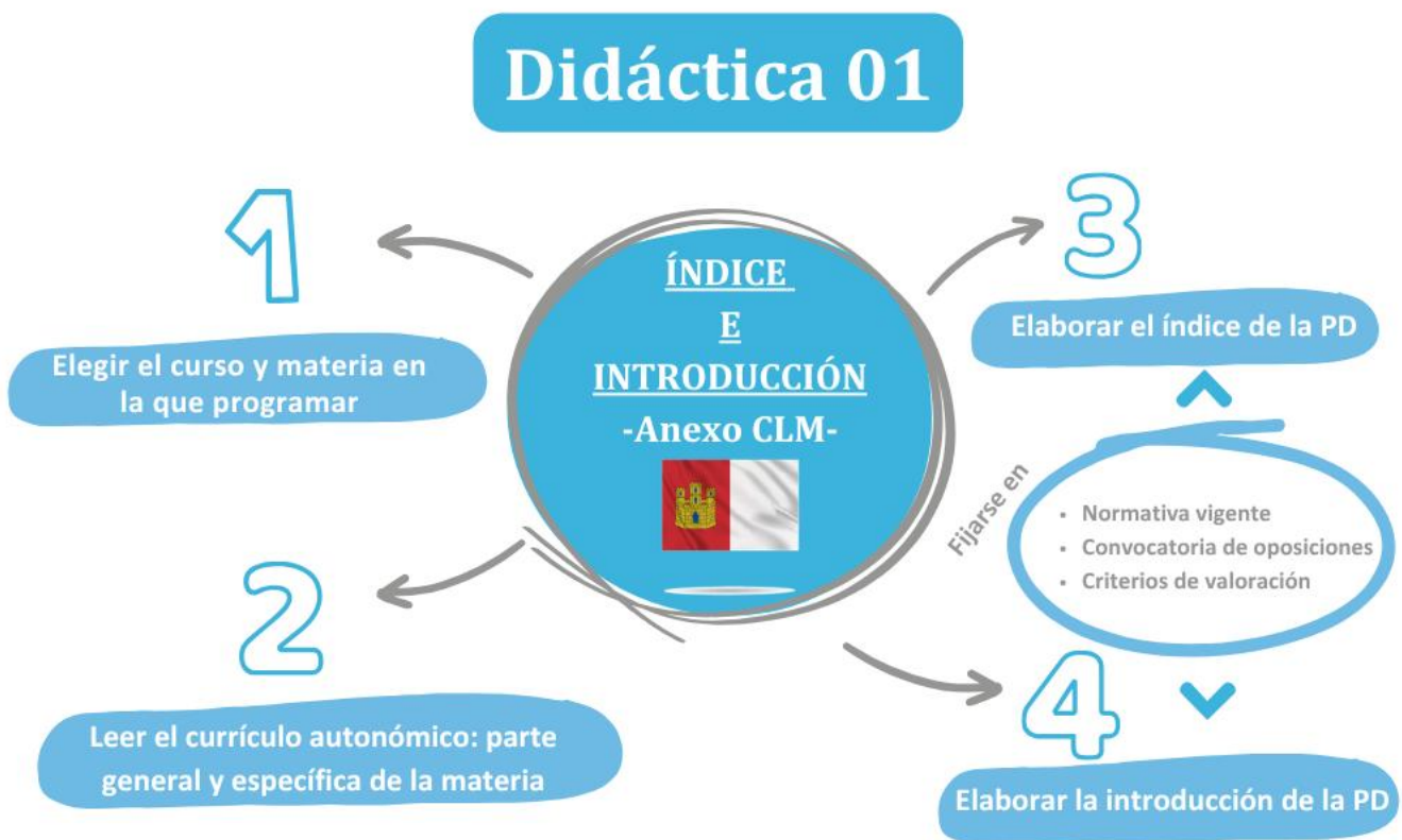
Imagen 2. ¿Qué hay que hacer esta semana?

Una vez que hayas hecho el índice, el siguiente paso es elaborar la introducción de tu programación didáctica, que consiste en presentar la materia, el curso y la etapa en que se enmarca, así como explicar los fundamentos sociales y pedagógicos que justifican su enseñanza. También debes hablar sobre la importancia de programar en educación.