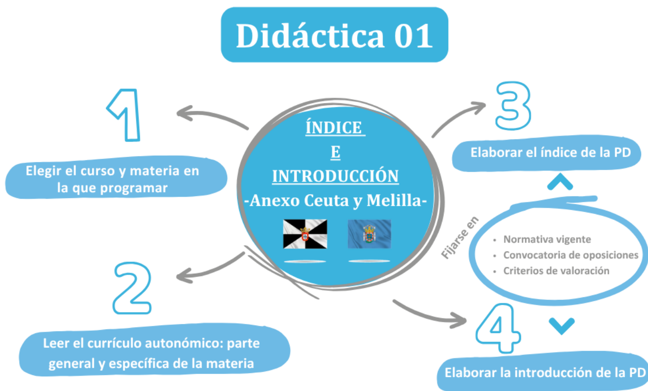
Imagen 2. ¿Qué hay que hacer esta semana?

Una vez que hayas hecho el índice, el siguiente paso es elaborar la introducción de tu programación didáctica, que consiste en presentar la materia, el curso y la etapa en que se enmarca, así como explicar los fundamentos sociales y pedagógicos que justifican su enseñanza.