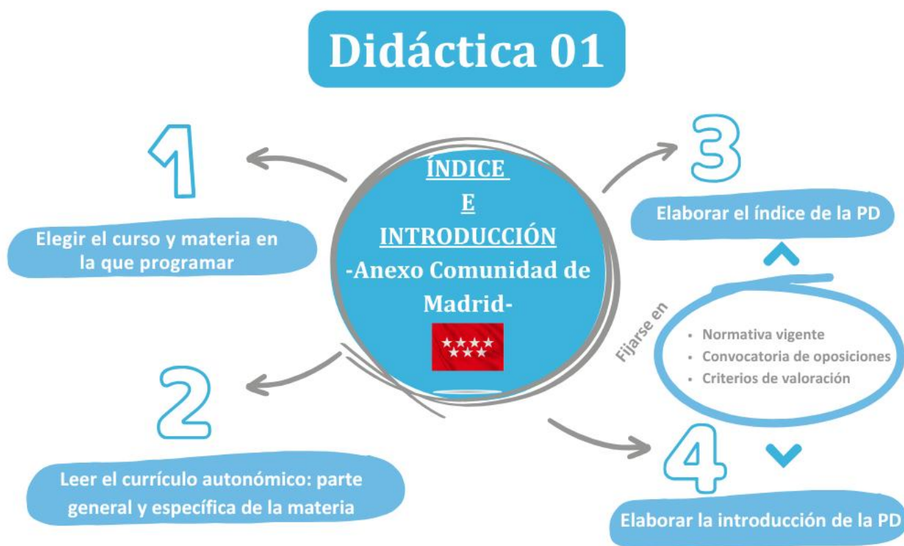
Imagen 2. ¿Qué hay que hacer esta semana?

Una vez que hayas hecho el índice, el siguiente paso es elaborar la introducción de tu programación didáctica, que consiste en presentar la materia, el curso y la etapa en que se enmarca, así como explicar la importancia de la materia en la que programas por actualidad, impacto, desafío, compromiso, finalidad, intención educativa, etc.