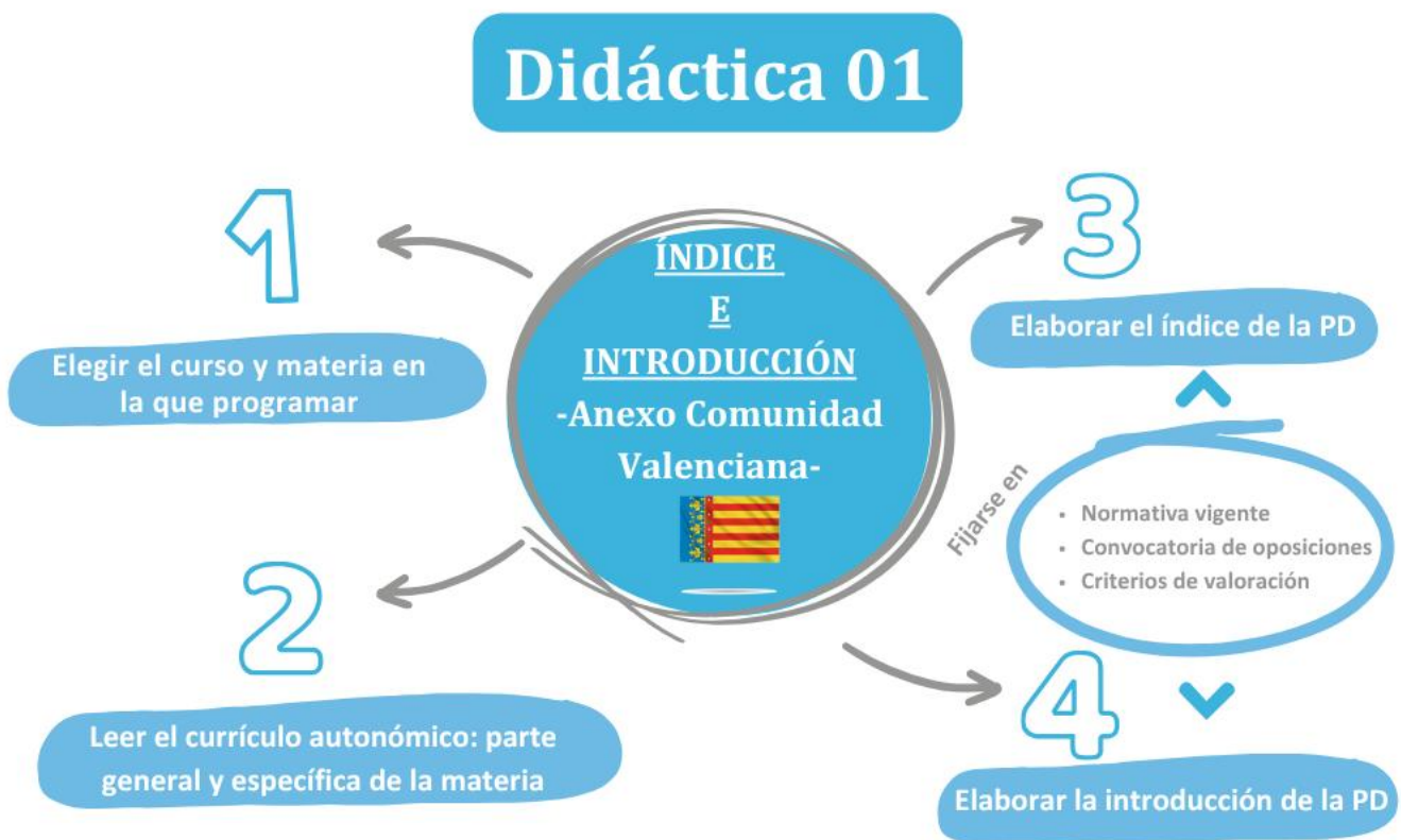
Imagen 2. ¿Qué hay que hacer esta semana?

Una vez que hayas hecho el índice, el siguiente paso es elaborar la introducción de tu programación de aula, que consiste en presentar las características de la materia, el curso y la etapa en que se enmarca, así como explicar los fundamentos sociales y pedagógicos que justifican su enseñanza.