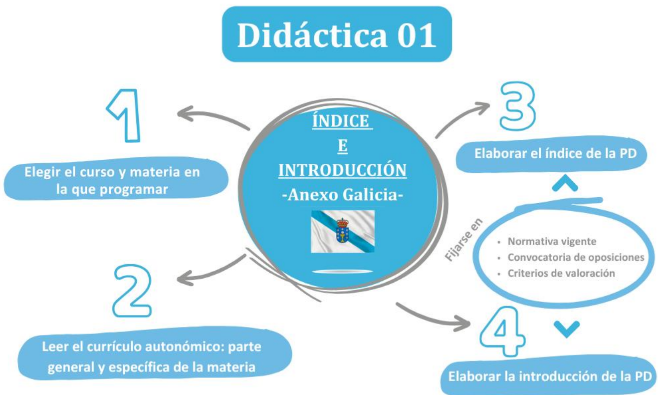
Imagen 2. ¿Qué hay que hacer esta semana?

Una vez que hayas hecho el índice, el siguiente paso es elaborar la introducción de tu programación didáctica, que consiste en presentar las características de la materia, el curso y la etapa en que se enmarca, así como explicar los fundamentos sociales y pedagógicos que justifican su enseñanza.