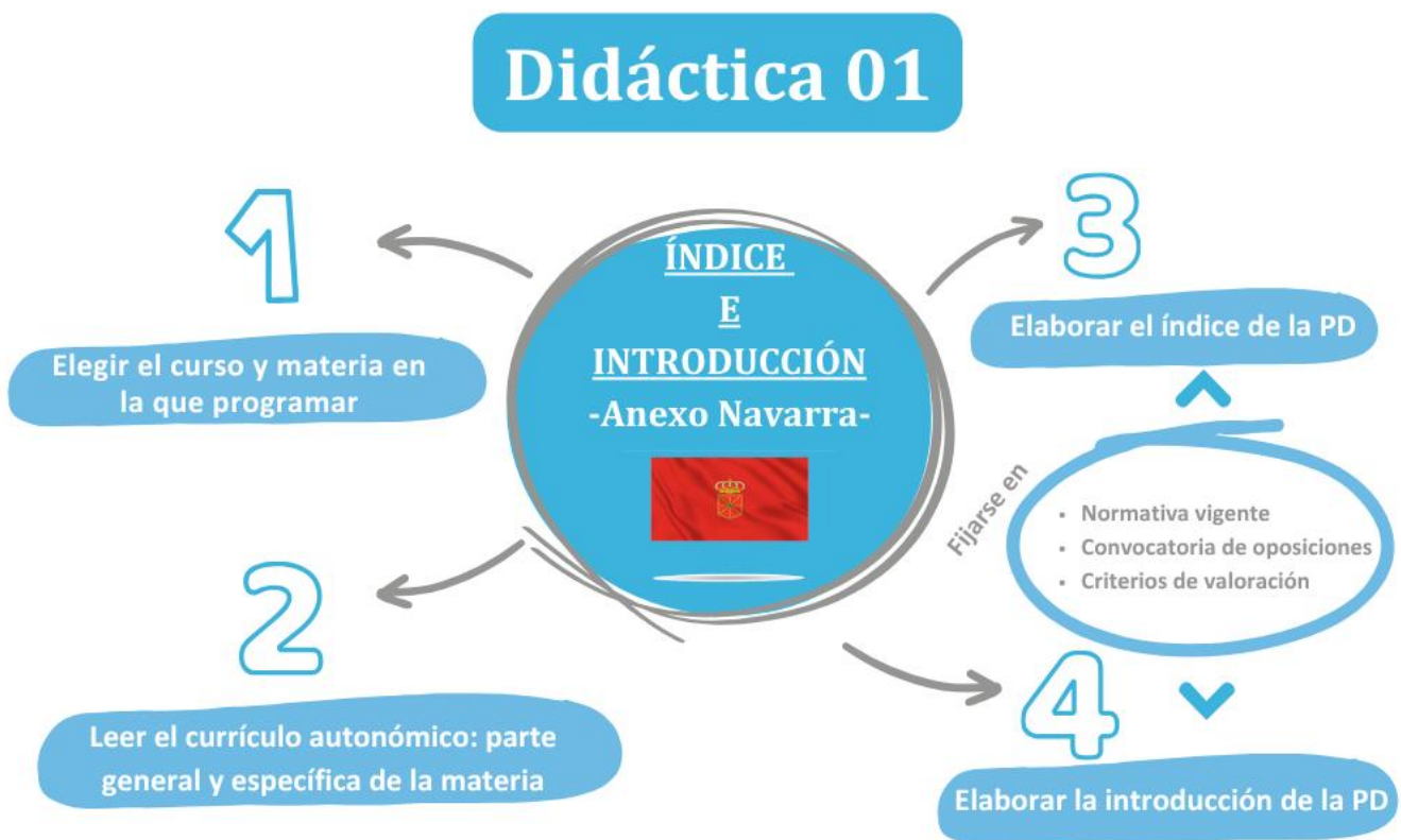
Imagen 2. ¿Qué hay que hacer esta semana?

Una vez que hayas hecho el índice, el siguiente paso es elaborar la introducción de tu programación didáctica, que consiste en presentar las características de la materia, el curso y la etapa en que se enmarca, así como explicar los fundamentos sociales y pedagógicos que justifican su enseñanza.