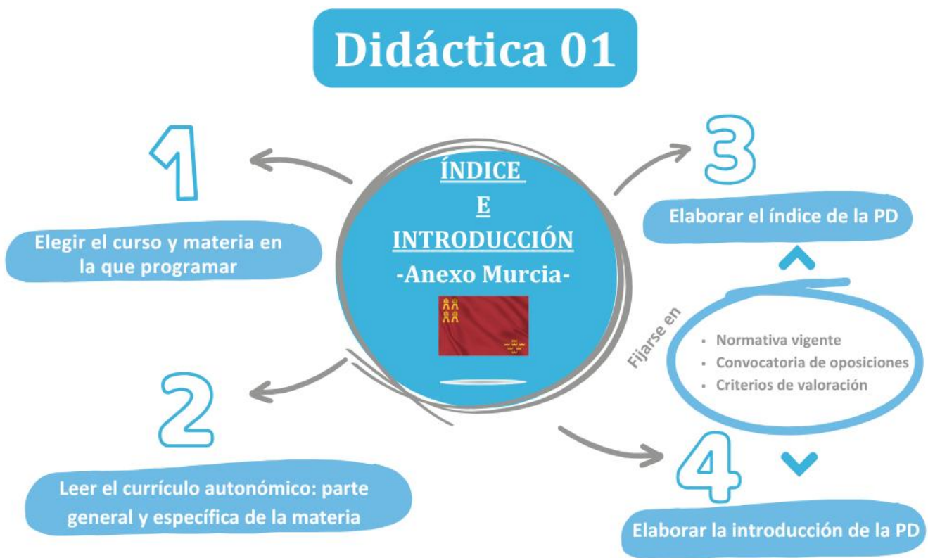
Imagen 2. ¿Qué hay que hacer esta semana?

Una vez que hayas hecho el índice, el siguiente paso es elaborar la introducción de tu programación didáctica, que consiste en justificar su inserción en el curso escolar y en la etapa educativa en que se enmarca, presentar las características de la materia, así como explicar los fundamentos sociales y pedagógicos que justifican su enseñanza.