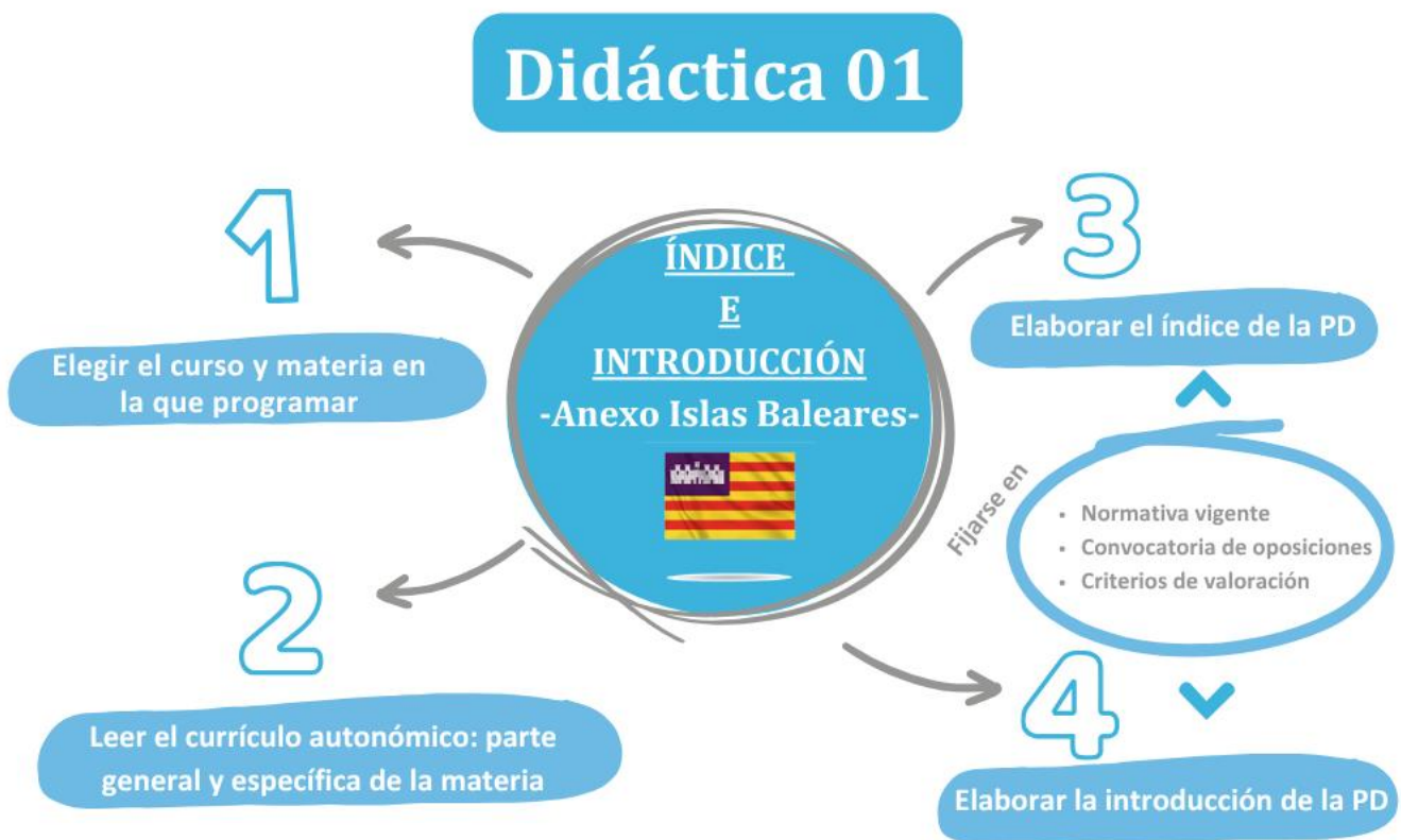
Imagen 2. ¿Qué hay que hacer esta semana?

Una vez que hayas hecho el índice, el siguiente paso es elaborar la introducción de tu programación didáctica, que consiste en presentar las características de la materia, el curso y la etapa en que se enmarca, así como explicar los fundamentos sociales y pedagógicos que justifican su enseñanza.